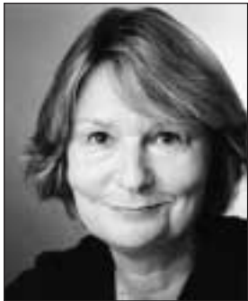
KIRSTEN BOIE, KINDER UND JUGENDBUCHAUTORIN

Oft ganz unerwartet gewinnt das Thema aber irgendwann in jeder Familie plötzlich an Bedeutung. Die Anlässe sind unterschiedlich, es können die Kinder sein, für die ihre Herkunft zur drängenden Frage wird oder die Eltern: Und dann ist nichts so wichtig, wie vertraute Menschen, deren Situation der eigenen ähnlich ist, die das Thema nicht von außen, sondern von innen sehen, die zuhören, Trost, Aufmunterung, manchmal auch ganz handfeste Tipps geben können. Die Adoptivfamiliientagung schafft hier ein tragfähiges Beziehungsnetz, Familien lernen sich über Jahre hin kennen, Eltern machen Workshops, joggen miteinander, sonnen sich, reden abends bei einem Glas Wein, Kinder und Jugendliche toben und basteln und machen Party. Freundschaften entstehen unter Erwachsenen und Kindern und halten jahrelang. Nichts kann besser den Stellenwert der Tagung im Leben der Teilnehmer zeigen, als die Antwort eines Grundschulkindes auf die Frage nach den großen Festen im Jahreslauf: „Weihnachten, Geburtstag und Bad Segeberg.“